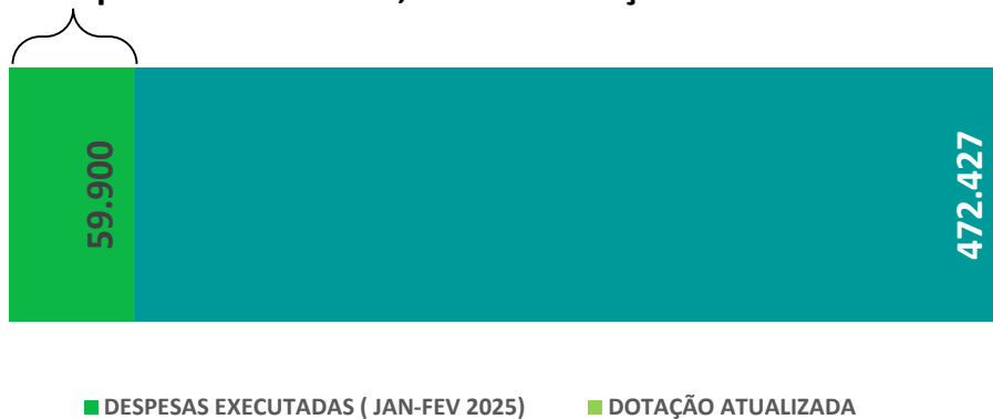
Gráfico Aplicação em ASPS 2025