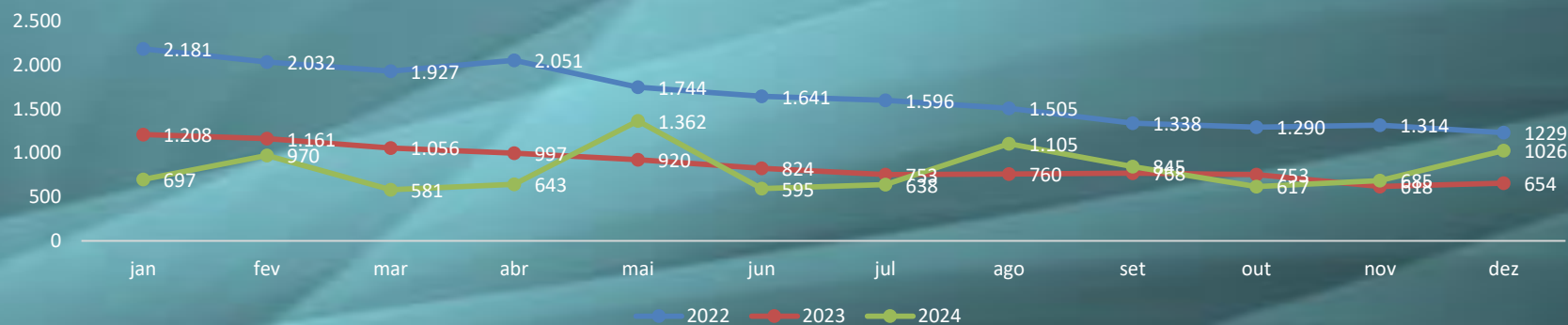
Gráfico da Evolução das Despesas com Iluminação Pública 2022-2024

Após consolidar toda a modernização, a estimativa é de geração de economia de 50% para a Prefeitura, já que a tecnologia de LED é 80% mais econômica do que as lâmpadas à vapor e 30% do que as fluorescentes. A Meta: Dos 60.033 pontos 100% de execução. A nova tecnologia oferece luz mais potente, o que no período noturno significa mais segurança e comodidade à população.