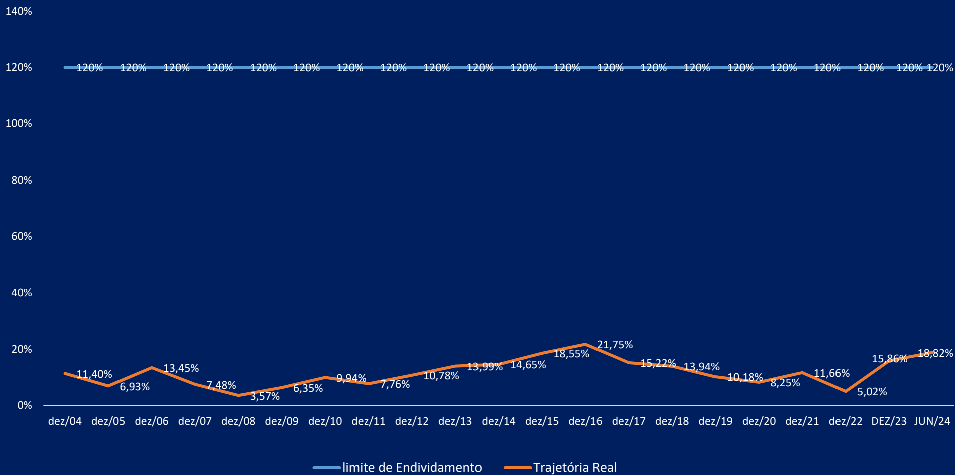
Gráfico Limite e Trajetória da Dívida Consolidada Líquida