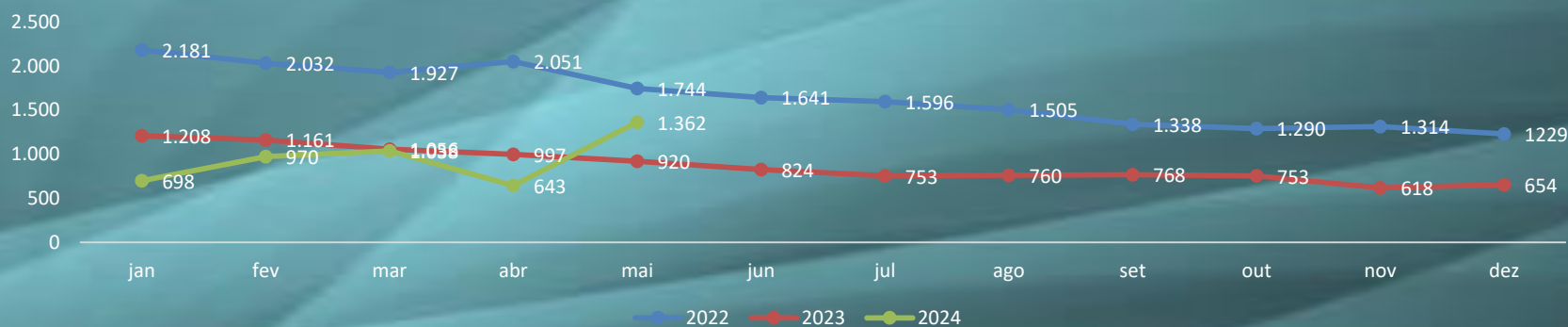
Gráfico da Evolução das Despesas com Iluminação Pública 2022-2024

Após consolidar toda a modernização, a estimativa é de geração de economia de 50% para a Prefeitura, já que a tecnologia de LED é 80% mais econômica do que as lâmpadas à vapor e 30% do que as fluorescentes. A Meta: Dos 60,033 pontos 100% de execução. A nova tecnologia oferece luz mais potente, o que no período noturno significa mais segurança e comodidade à população.